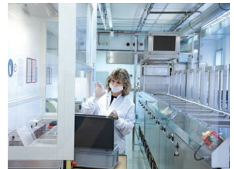
Modernste CNC-Ausrüstungen ermöglichen die Fertigung verschiedener konvexer und konkaver Oberflächenformen.