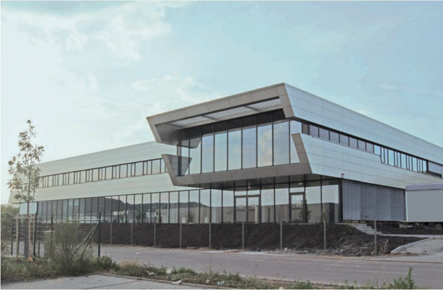
Der Firmenneubau der piezosystem jena GmbH, mit hochpräzisen Messräumen im Untergeschoss.